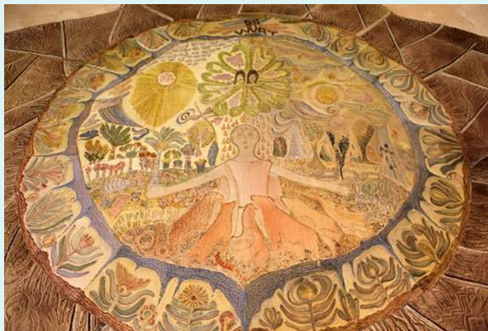
Altarbild St. Michael, Hoya

Brinkum - Bruchhausen-Vilsen - Hoya - Kirchweyhe - Syke