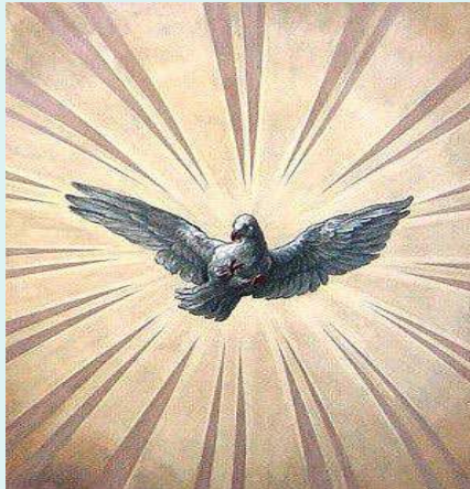
Deckengemälde in der Wiener Karlskirche, von Johann Michael Rottmayr, 18. Jhd

Brinkum - Bruchhausen-Vilsen - Hoya - Kirchweyhe - Syke