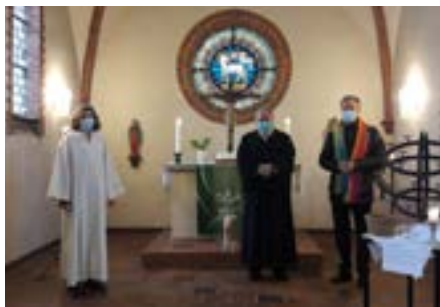
Text und Foto: Claudia Suffner

Am 16. Mai um 11:00 Uhr feiern wir dann in der ev. Vilsener Kirche gemeinsam und ökumenisch den gestreamten Abschlussgottesdienst des 3. ÖKT aus Frankfurt/Main mit. Wer möchte, kann sich diesen Termin schon einmal in den Kalender eintragen.