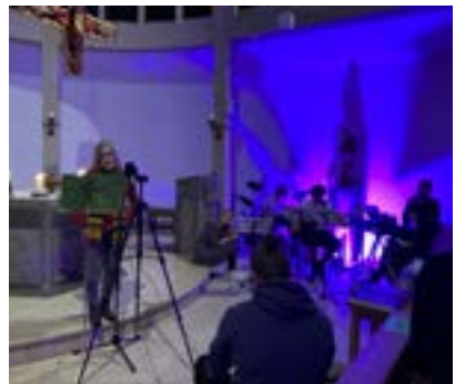
Übertragung der Jugendvesper am 5.11.2020 aus der Kirche HeiligGeist

Do 03.12., 20:00 Uhr Teilnahme über Instagram @berufederkirche_os